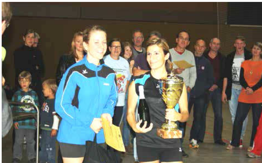
Der SV Vaihingen holte sich den Pott.